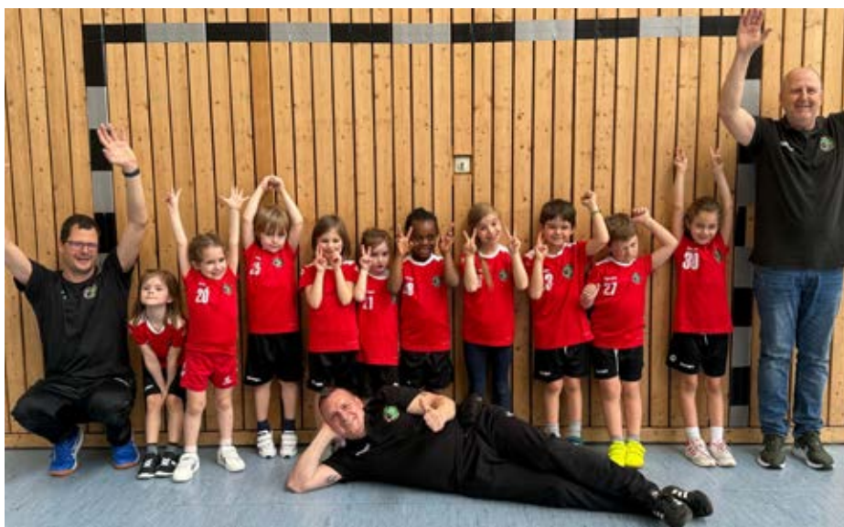
Minis Süd in Deizisau

mJB: Am heutigen Sonntag trat das Team Esslingen in der Sporthalle Sulzgries in der Vor-