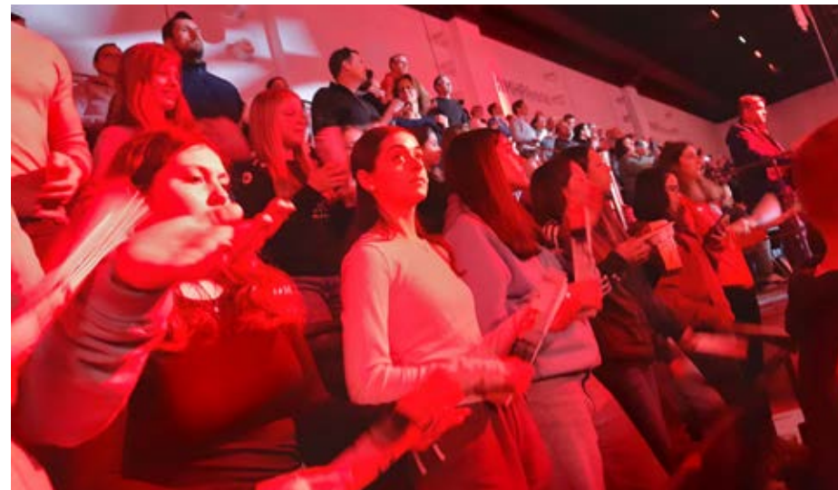
wC und wD

Am 15.3. war es endlich soweit: auch wir Minis vom Esslinger Süden durften in unseren neuen Trikots beim Minispielfest in Deizisau zum ersten Mal zeigen, dass wir zwar noch Minis, aber schon