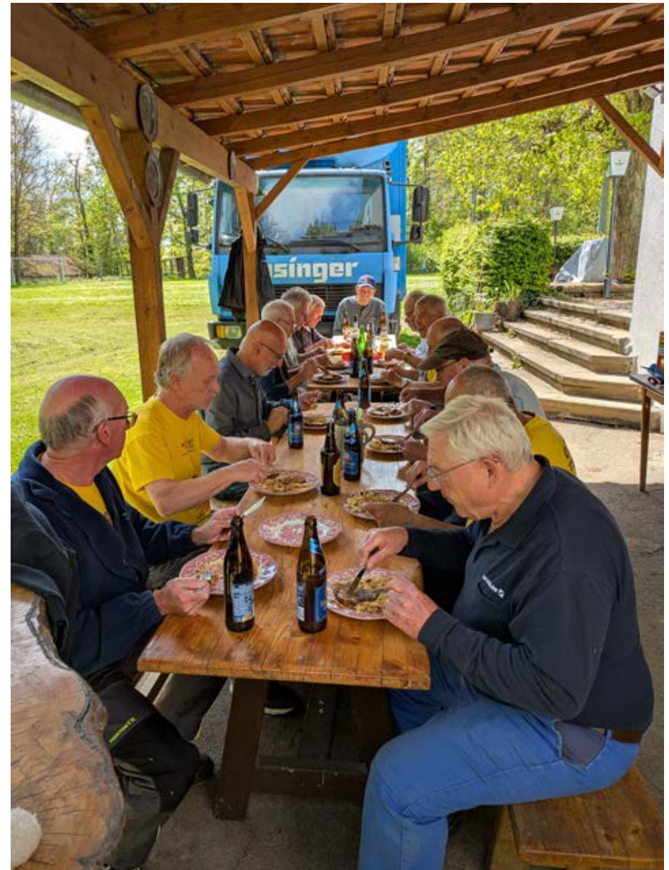
MAD beim Mittagessen