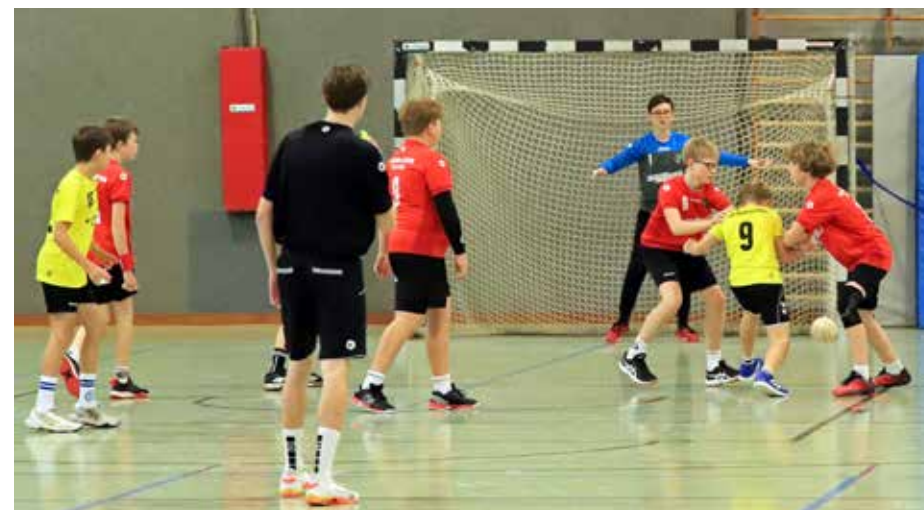
gJD beim 10. Spieltag

Die mJC spielt in dieser Saison in der Bezirksoberliga und belegt den 6. Tabellenplatz. Hier geht der Blick zu einem gesicherten Mittelfeldplatz.